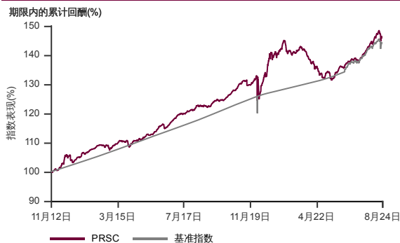
表现指标图截至2024年8月30日*

2012年10月至2024年8月 净资产值 - 净资产价格和假设收入再投资到基金, 其总投资是以马币为基础。基金价格和收益(视情形而定)随时波动 过去表现不应视为未来表现的准则。 来源:晨星星