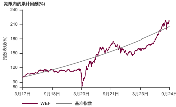
表现指标图截至2024年9月30日*

2017年3月至2024年9月 净资产值 - 净资产价格和假设收入再投资到基金, 其总投资是以马币为基础。基金价格和收益(视情形而定)随时波动 过去表现不应视为未来表现的准则。