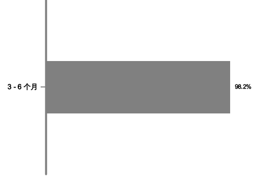
届满状况截至2023年9月29日*