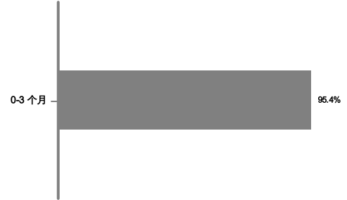
届满状况截至2024年10月30日*