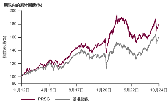
表现指标图截至2024年10月30日*

2012年10月至2024年10月 净资产值 - 净资产价格和假设收入再投资到基金, 其总投资是以马币为基础。基金价格和收益(视情形而定)随时波动 过去表现不应视为未来表现的准则。