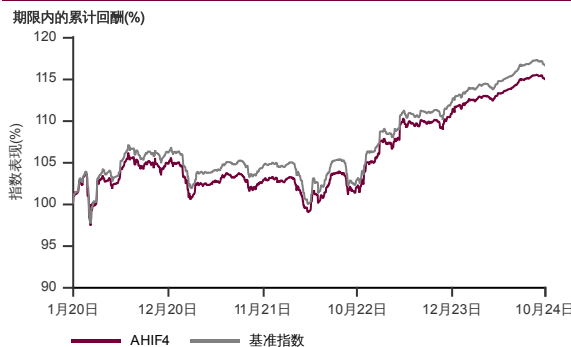
表现指标图截至2024年10月31日*

2020年1月至2024年10月 净资产值 - 净资产价格和假设收入再投资到基金, 其总投资是以马币为基础。基金价格和收益(视情形而定)随时波动 过去表现不应视为未来表现的准则。