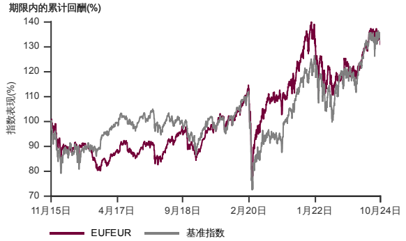
表现指标图截至2024年10月30日*

2015年11月至2024年10月 净资产值 - 净资产值价格和假设收入再投资到基金, 其总投资是以欧元为基础。基金价格和收益(视情形而定) 随时波动 过去表现不应视为未来表现的准则。