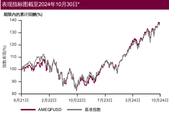
2021年5月至2024年10月 净资产值 - 净资产值价格和假设收入再投资到基金,其总投资是以美元为基础。基金价格和收益(视情形而定)随时波动 过去表现不应视为未来表现的准则。 来源:晨星星

最低投资额 / 额外投资额* 美元10,000 / 美元5,000(美元) 马币30,000 / 马币10,000(马币对冲) 马币30,000 / 马币10,000(马币) 新币10,000 / 新币5,000(新币对冲) 澳币10,000 / 澳币5,000(澳币对冲) 截至2024年10月30日基金资产值 / 单位资产净值 美元9.5百万 / 美元0.6882(美元) 马币190.2百万 / 马币0.6629(马币对冲) 马币30.2百万 / 马币0.5805(马币) 新币7.4百万 / 新币0.6611(新币对冲) 澳币14.4百万 / 澳币0.6528(澳币对冲)