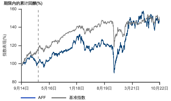
表现指标图截至2022年10月31日*

2014年9月至2022年10月 净资产值 - 净资产价格和假设收入再投资到基金，其总投资是以马币为基础。基金价格和收益(视情形而定)随时波动 过去表现不应视为未来表现的准则。截至2015年9月08日 基准被替换为 50% 富时东盟40指数 + 50% RAM Quant Shop 大马政府债券全指数。