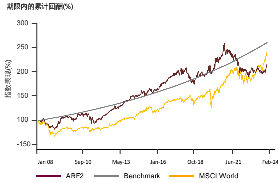
表现指标图截至2024年2月29日*

2007年12月至2024年2月 净资产值 - 净资产值价格和假设收入再投资到基金, 其总投资是以马币为基础。基金价格和收益(视情形而定)随时波动 过去表现不应视为未来表现的准则。