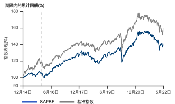
表现指标图截至2022年5月31日*

2014年12月至2022年5月 净资产值 - 净资产价格和假设收入再投资到基金, 其总投资是以马币为基础。基金价格和收益(视情形而定)随时波动 过去表现不应视为未来表现的准则。截至2015年12月08日 基准被替换为 50% MSCI 亚太所有国家除日本指数 + 50% RAM Quantshop大马政府债券全指数。