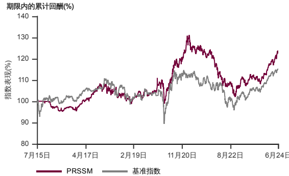
表现指标图截至2024年6月28日*

2015年7月至2024年6月 净资产值 - 净资产价格和假设收入再投资到基金, 其总投资是以马币为基础。基金价格和收益(视情形而定)随时波动 过去表现不应视为未来表现的准则。 来源: 晨星