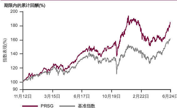
表现指标图截至2024年6月28日*

2012年10月至2024年6月 净资产值 - 净资产价格和假设收入再投资到基金，其总投资是以马币为基础。基金价格和收益(视情形而定)随时波动 过去表现不应视为未来表现的准则。