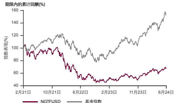
表现指标图截至2024年6月28日*

2021年1月至2024年6月 净资产值 - 净资产价格和假设收入再投资到基金, 其总投资是以美元为基础。基金价格和收益(视情形而定)随时波动 过去表现不应视为未来表现的准则。