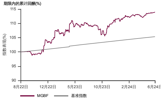
表现指标图截至2024年6月28日*

2022年7月至2024年6月 净资产值 - 净资产值价格和假设收入再投资到基金, 其总投资是以马币为基础。基金价格和收益(视情形而定)随时波动 过去表现不应视为未来表现的准则。