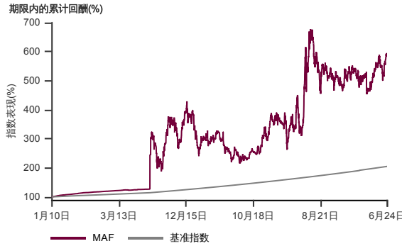
表现指标图截至2024年6月28日*

2010年1月至2024年6月 净资产值 - 净资产值价格和假设收入再投资到基金, 其总投资是以马币为基础。基金价格和收益(视情形而定)随时波动 过去表现不应视为未来表现的准则。