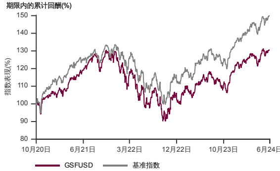
表现指标图截至2024年6月28日*

2020年9月至2024年6月 净资产值 - 净资产值价格和假设收入再投资到基金，其总投资是以美元为基础。基金价格和收益(视情形而定)随时变动。过去表现不应视为未来表现的准则。