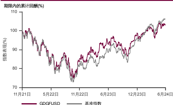
表现指标图截至2024年6月28日*

2021年10月至2024年6月 净资产值 - 净资产价值和假设收入再投资到基金，其总投资是以美元为基础。基金价格和收益(视情形而定)随时波动 过去表现不应视为未来表现的准则。