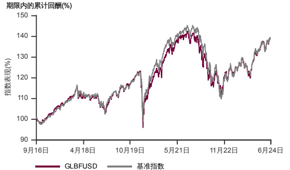
表现指标图截至2024年6月28日*

2016年9月至2024年6月 净资产值 - 净资产值价格和假设收入再投资到基金，其总投资是以美元为基础。基金价格和收益(视情形而定)随时波动 过去表现不应视为未来表现的准则。