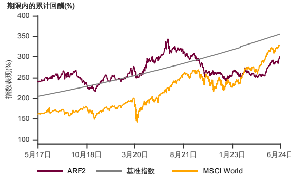
表现指标图截至2024年6月28日*

2007年12月至2024年6月 净资产值 - 净资产价值和假设收入再投资到基金, 其总投资是以马币为基础。基金价格和收益(视情形而定)随时波动 过去表现不应视为未来表现的准则。