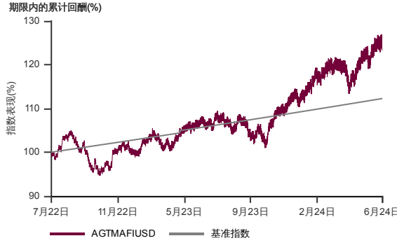
表现指标图截至2024年6月28日*

2022年6月至2024年6月 净资产值 - 净资产价格和假设收入再投资到基金, 其总投资是以美元为基础。基金价格和收益(视情形而定)随时波动 过去表现不应视为未来表现的准则。