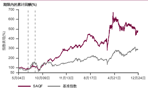
表现指标图截至2024年12月31日*

2004年4月至2024年12月 净资产值 - 净资产值价格和假设收入再投资到基金, 其总投资是以马币为基础。基金价格和收益(视情形而定)随时波动 过去表现不应视为未来表现的准则。截至2006年6月26日 基准被替换为 富时大马小盘股指数。截至2008年2月04日 基准被替换为 MSCI 亚洲所有国家除日本小型股指数。来源:晨星星