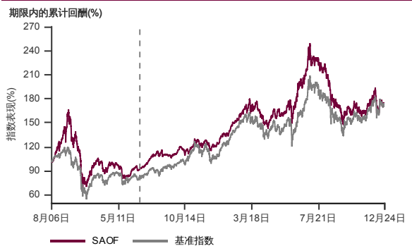
表现指标图截至2024年12月31日*

2006年7月至2024年12月 净资产值 - 净资产价格和假设收入再投资到基金, 其总投资是以马币为基础。基金价格和收益(视情形而定)随时波动 过去表现不应视为未来表现的准则。截至2012年6月15日 基准被替换为 MSCI 亚洲所有国家除日本指数 EDITED。