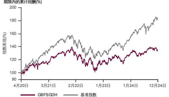
表现指标图截至2024年12月31日*

2020年3月至2024年12月 净资产值 - 净资产价格和假设收入再投资到基金, 其总投资是以美元为基础。基金价格和收益(视情形而定)随时波动 过去表现不应视为未来表现的准则。来源:晨星星