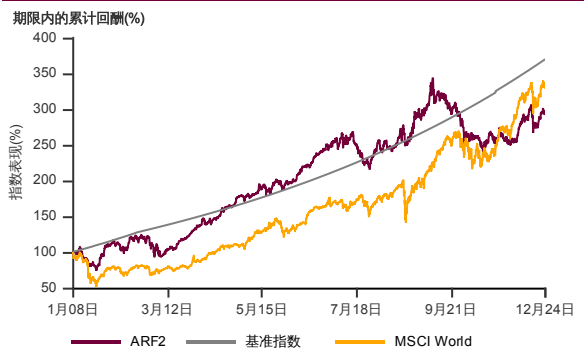
2007年12月至2024年12月 净资产值 - 净资产值价格和假设收入再投资到基金, 其总投资是以马币为基础。基金价格和收益(视情形而定) 随时波动 过去表现不应视为未来表现的准则。