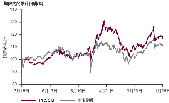
表现指标图截至2025年1月31日*

2015年7月至2025年1月 净资产值 - 净资产价格和假设收入再投资到基金, 其总投资是以马币为基础。基金价格和收益(视情形而定)随时波动 过去表现不应视为未来表现的准则。