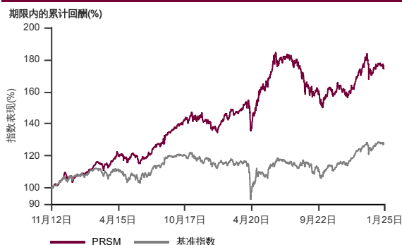
表现指标图截至2025年1月31日*

2012年10月至2025年1月 净资产值 - 净资产价格和假设收入再投资到基金，其总投资是以马币为基础。基金价格和收益(视情形而定)随时波动 过去表现不应视为未来表现的准则。