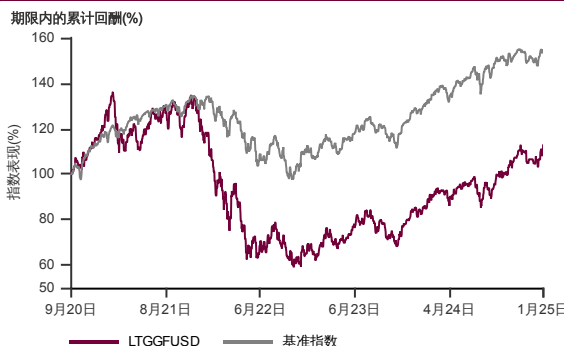
表现指标图截至2025年1月31日*

2020年9月至2025年1月 净资产值 - 净资产价格和假设收入再投资到基金，其总投资是以美元为基础。基金价格和收益(视情形而定)随时波动 过去表现不应视为未来表现的准则。