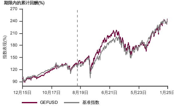
表现指标图截至2025年1月31日*

2015年11月至2025年1月 净资产值 - 净资产值价格和假设收入再投资到基金, 其总投资是以美元为基础。基金价格和收益(视情形而定)随时波动 过去表现不应视为未来表现的准则。截至2019年5月01日 基准被替换为 MSCI 所有国家世界指数。来源:晨星星