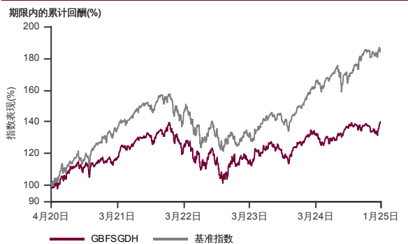
表现指标图截至2025年1月31日*

2020年3月至2025年1月 净资产值 - 净资产价格和假设收入再投资到基金, 其总投资是以美元为基础。基金价格和收益(视情形而定)随时波动 过去表现不应视为未来表现的准则。