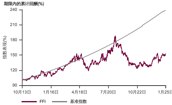
表现指标图截至2025年1月31日*

2013年10月至2025年1月 净资产值 - 净资产价格和假设收入再投资到基金, 其总投资是以马币为基础。基金价格和收益(视情形而定)随时波动 过去表现不应视为未来表现的准则。