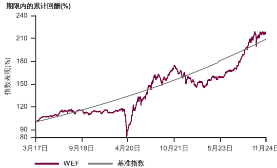
表现指标图截至2024年11月29日*

2017年3月至2024年11月 净资产值 - 净资产价格和假设收入再投资到基金, 其总投资是以马币为基础。基金价格和收益(视情形而定)随时波动 过去表现不应视为未来表现的准则。