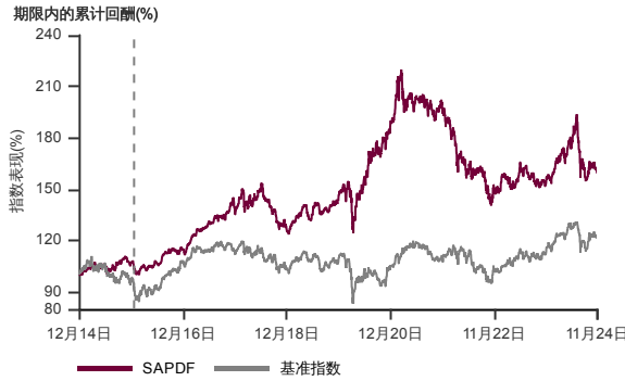
表现指标图截至2024年11月29日*

2014年12月至2024年11月 净资产值 - 净资产价格和假设收入再投资到基金, 其总投资是以马币为基础。基金价格和收益(视情形而定)随时波动过去表现不应视为未来表现的准则。截至2015年12月08日 基准被替换为 MSCI 亚太所有国家除日本高股息回酬率指数。