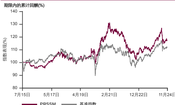
表现指标图截至2024年11月29日*

2015年7月至2024年11月 净资产值 - 净资产价格和假设收入再投资到基金，其总投资是以马币为基础。基金价格和收益(视情形而定)随时波动 过去表现不应视为未来表现的准则。