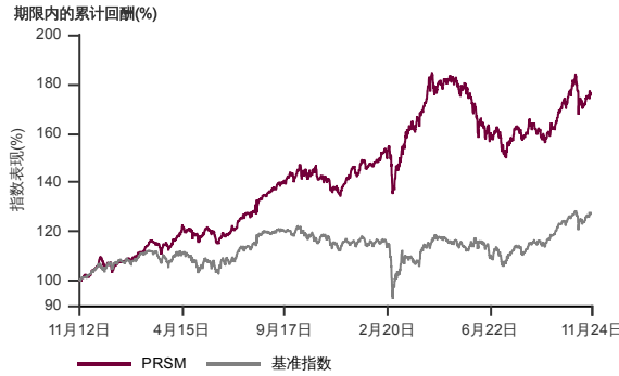
表现指标图截至2024年11月29日*

2012年10月至2024年11月 净资产值 - 净资产价格和假设收入再投资到基金，其总投资是以马币为基础。基金价格和收益(视情形而定)随时波动 过去表现不应视为未来表现的准则。