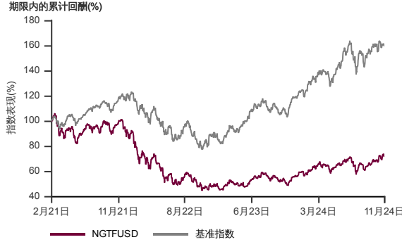
表现指标图截至2024年11月29日*

2021年1月至2024年11月 净资产值 - 净资产值价格和假设收入再投资到基金，其总投资是以美元为基础。基金价格和收益(视情形而定)随时波动 过去表现不应视为未来表现的准则。