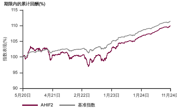
表现指标图截至2024年11月29日*

2017年10月至2024年11月 净资产值 - 净资产价格和假设收入再投资到基金, 其总投资是以马币为基础。基金价格和收益(视情形而定)随时波动 过去表现不应视为未来表现的准则。 来源: 晨星星