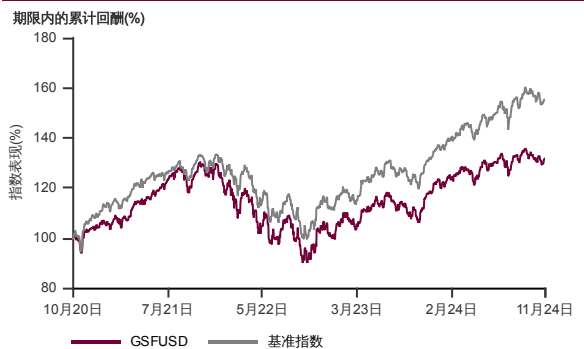
表现指标图截至2024年11月29日*

2020年9月至2024年11月 净资产值 - 净资产价格和假设收入再投资到基金，其总投资是以美元为基础。基金价格和收益(视情形而定)随时波动 过去表现不应视为未来表现的准则。