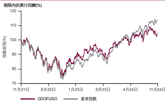
表现指标图截至2024年11月29日*

2021年10月至2024年11月 净资产值 - 净资产价格和假设收入再投资到基金, 其总投资是以美元为基础。基金价格和收益(视情形而定) 随时波动 过去表现不应视为未来表现的准则。