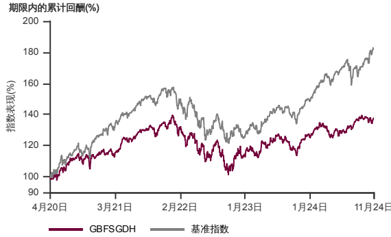
表现指标图截至2024年11月29日*

2020年3月至2024年11月 净资产值 - 净资产价格和假设收入再投资到基金, 其总投资是以美元为基础。基金价格和收益(视情形而定)随时波动 过去表现不应视为未来表现的准则。