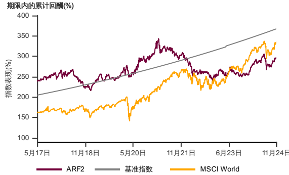
表现指标图截至2024年11月29日*

2007年12月至2024年11月 净资产值 - 净资产值价格和假设收入再投资到基金, 其总投资是以马币为基础。基金价格和收益(视情形而定) 随时波动 过去表现不应视为未来表现的准则。