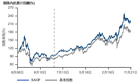
表现指标图截至2021年11月30日*

2006年7月至2021年11月 净资产值 - 净资产价格和假设收入再投资到基金, 其总投资是以马币为基础。基金价格和收益(视情形而定)随时波动 过去表现不应视为未来表现的准则。截至2012年6月15日 基准被替换为 MSCI 亚洲所有国家除日本指数。