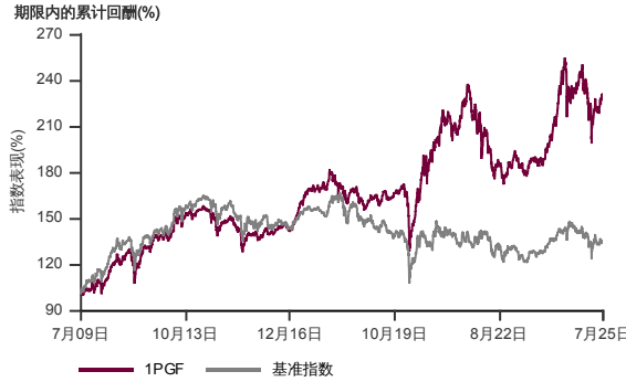
表现指标图截至2025年7月31日*

2009年7月至2025年7月 净资产值 - 净资产价格和假设收入再投资到基金，其总投资是以马币为基础。基金价格和收益(视情形而定)随时波动 过去表现不应视为未来表现的准则。