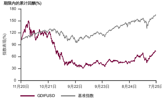
表现指标图截至2025年7月31日*

2020年10月至2025年7月 净资产值 - 净资产值价格和假设收入再投资到基金，其总投资是以美元为基础。基金价格和收益(视情形而定)随时波动 过去表现不应视为未来表现的准则。