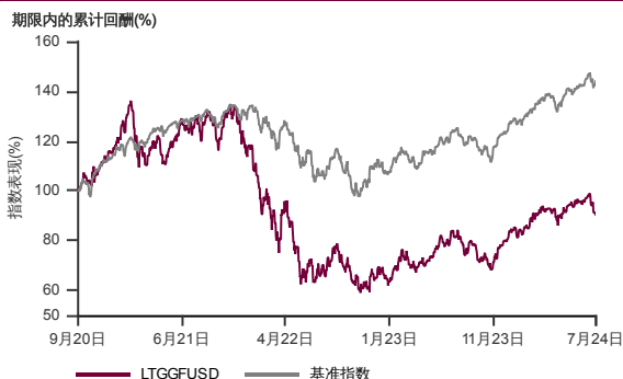
表现指标图截至2024年7月31日*

2020年9月至2024年7月 净资产值 - 净资产价格和假设收入再投资到基金，其总投资是以美元为基础。基金价格和收益(视情形而定)随时波动 过去表现不应视为未来表现的准则。