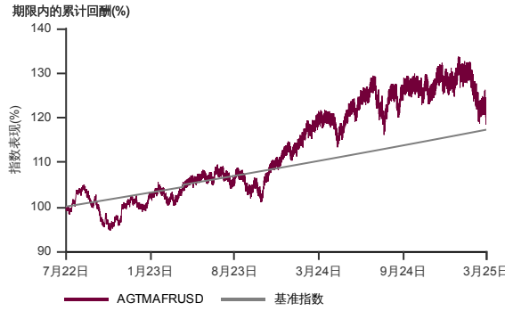
表现指标图截至2025年3月28日*

2022年6月至2025年3月 净资产值 - 净资产价格和假设收入再投资到基金, 其总投资是以美元为基础。基金价格和收益(视情形而定)随时波动 过去表现不应视为未来表现的准则。