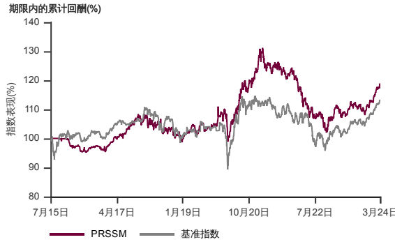
表现指标图截至2024年3月29日*

2015年7月至2024年3月 净资产值 - 净资产价格和假设收入再投资到基金, 其总投资是以马币为基础。基金价格和收益(视情形而定)随时波动 过去表现不应视为未来表现的准则。