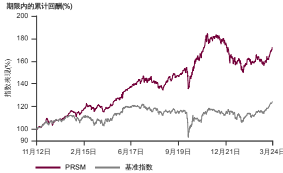
表现指标图截至2024年3月29日*

2012年10月至2024年3月 净资产值 - 净资产价格和假设收入再投资到基金，其总投资是以马币为基础。基金价格和收益(视情形而定)随时波动 过去表现不应视为未来表现的准则。