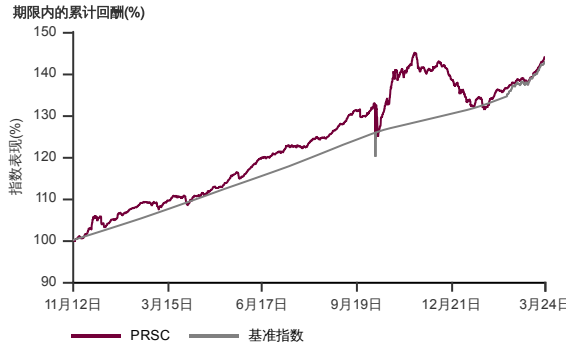
表现指标图截至2024年3月29日*

2012年10月至2024年3月 净资产值 - 净资产价格和假设收入再投资到基金, 其总投资是以马币为基础。基金价格和收益(视情形而定)随时波动 过去表现不应视为未来表现的准则。