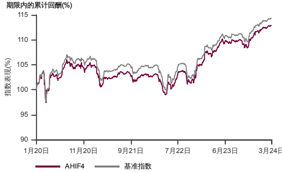
表现指标图截至2024年3月29日*

2020年1月至2024年3月 净资产值 - 净资产值价格和假设收入再投资到基金, 其总投资是以马币为基础。基金价格和收益(视情形而定)随时波动 过去表现不应视为未来表现的准则。